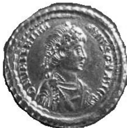
VALENTINIANVS II 375-392 d.C.

Normale legenda al rovescio: DN VALENTINIANVS PF AVG, DN VALENTINIANVS IVN PF AVG Zecche: Cyzicus, Costantinopoli, Thessalonica, Roma, Lyon, Treviri, Alexandria, Aquileia, Siscia