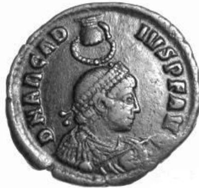
ARCADIVS 383-408 d.C.

Normale legenda al rovescio: DN ARCADIVS PF AVG, DN ARCADIVS PF AVG