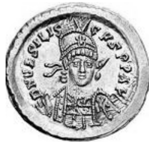
BASILISCVS 475-476 d.C.

< http://www.storiadelmondo.com/52/giambonino.bronzi.pdf > in Storiadelmondo n. 52, 7 aprile 2008