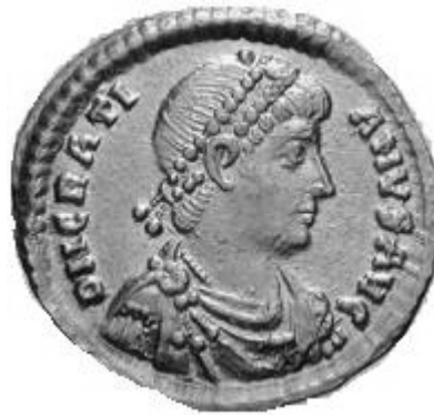
GRATIANVS 367-383 d.C.

Normale legenda al rovescio: DN GRATIANVS PF AVG; DN GRATIANVS AVG