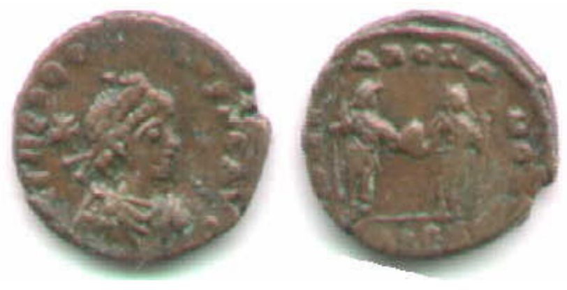
GLORIA ROMANORVM – IMPERATORI CON GLOBO