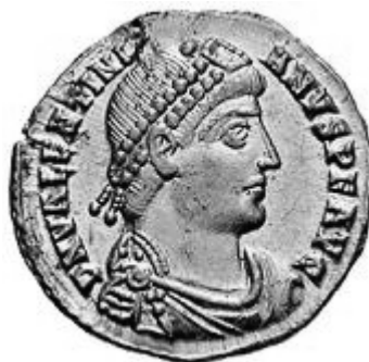
VALENTINIANVS I 364-375 d.C.

Normale legenda al rovescio: DN VALENTINIANVS PF AVG