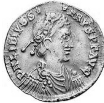
LIBIVS SEVERVS III 461-465 d.C.

http://www.storiadelmondo.com/52/giambonino.bronzi.pdf in Storiadelmondo n. 52, 7 aprile 2008