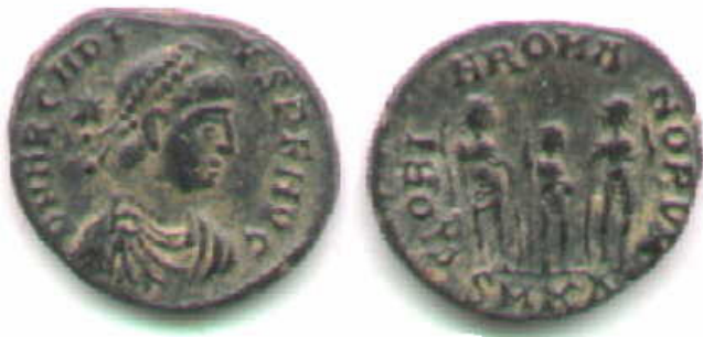
GLORIA ROMANORVM – TRE IMPERATORI SUPPLICANTE.