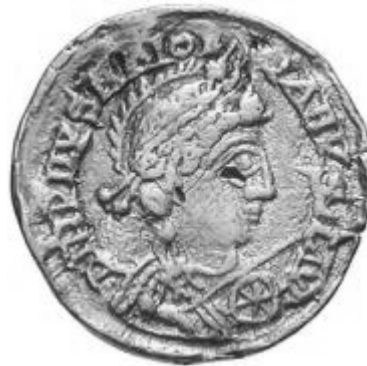
MAIORIANVS 457- 461 d.C.

http://www.storiadelmondo.com/52/giambonino.bronzi.pdf in Storiadelmondo n. 52, 7 aprile 2008