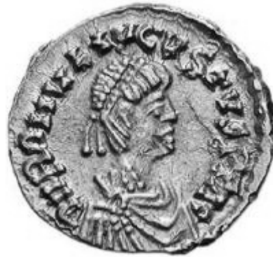
ROMOLVS AVGVSTVS 475-476 d.C.

http://www.storiadelmondo.com/52/giambonino.bronzi.pdf in Storiadelmondo n. 52, 7 aprile 2008