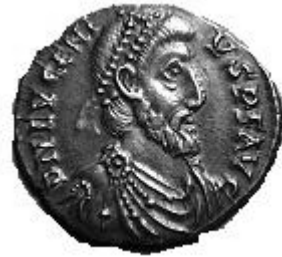
EVGENIVS 392-394 d.C.

http://www.storiadelmondo.com/52/giambonino.bronzi.pdf in Storiadelmondo n. 52, 7 aprile 2008