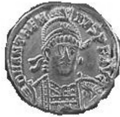
ANTHEMIVS 467-472 d.C.

http://www.storiadelmondo.com/52/giambonino.bronzi.pdf in Storiadelmondo n. 52, 7 aprile 2008