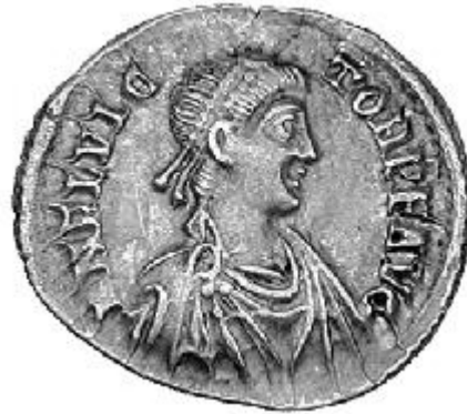
FLAVIVS VICTOR 387-388 d.C.

http://www.storiadelmondo.com/52/giambonino.bronzi.pdf in Storiadelmondo n. 52, 7 aprile 2008