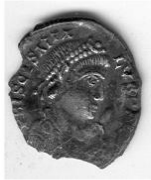
PRISCVS ATTALVS 409-410 / 414-415 d.C.

< http://www.storiadelmondo.com/52/giambonino.bronzi.pdf > in Storiadelmondo n. 52, 7 aprile 2008