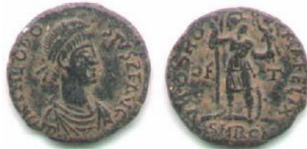
VRBS ROMA FELIX