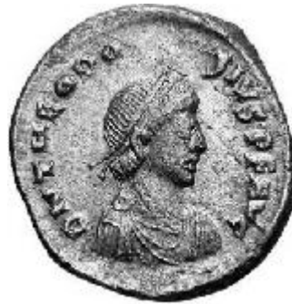
THEODOSIVS II 402-450 d.C.

Normale legenda al rovescio: DN THEODOSIVS PF AVG