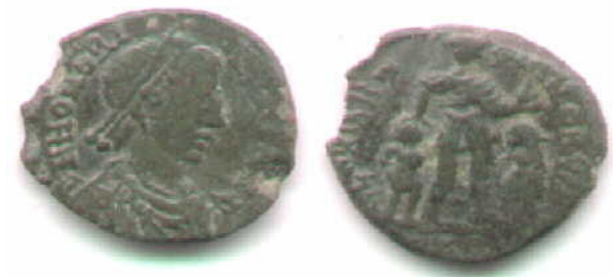
GLORIA ROMANORVM – IMP + PRIGIONIERO +