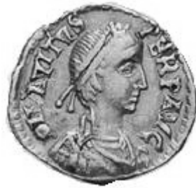
AVITVS 455-456 d.C.

http://www.storiadelmondo.com/52/giambonino.bronzi.pdf in Storiadelmondo n. 52, 7 aprile 2008