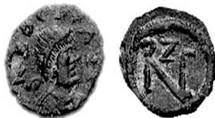
ZENO 474-491 d.C.

Normale legenda al rovescio: DN ZENO PF AVG, DN ZENO PERP AVG