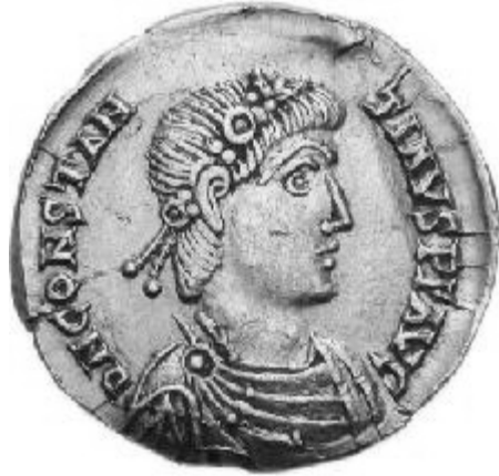
CONSTANTINVS III 407-411 d.C.

http://www.storiadelmondo.com/52/giambonino.bronzi.pdf in Storiadelmondo n. 52, 7 aprile 2008