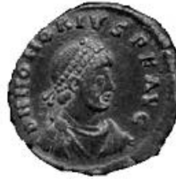
HONORIVS 393-423 d.C.

Normale legenda al rovescio: DN HONORIVS PF AVG, DN ONORIVS PF AVG