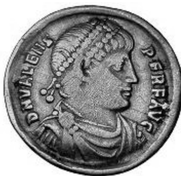
VALENS 364-378 d.C.

Normale legenda al rovescio: DN VALENS PF AVG