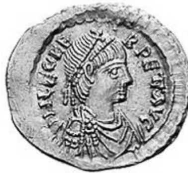
LEO I 457-474 d.C.

Normale legenda al rovescio: DN LEO PF AVG, DN LEOS PF AVG, DN LEONS PF AVG