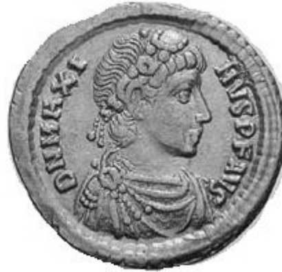
MAGNVS MAXIMVS 383-388 d.C.

http://www.storiadelmondo.com/52/giambonino.bronzi.pdf in Storiadelmondo n. 52, 7 aprile 2008