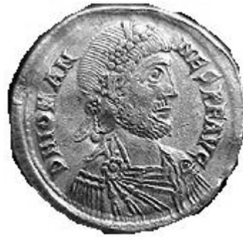
JOHANNES 423-425 d.C.

http://www.storiadelmondo.com/52/giambonino.bronzi.pdf in Storiadelmondo n. 52, 7 aprile 2008