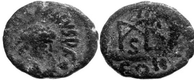
MARCIVNS 450-457 d.C.

http://www.storiadelmondo.com/52/giambonino.bronzi.pdf in Storiadelmondo n. 52, 7 aprile 2008