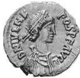
IVLIVS NEPOS 474-475 d.C.

< http://www.storiadelmondo.com/52/giambonino.bronzi.pdf > in Storiadelmondo n. 52, 7 aprile 2008