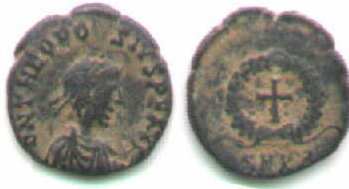
CROCE IN GHIRLANDA

http://www.storiadelmondo.com/52/giambonino.bronzi.pdf in Storiadelmondo n. 52, 7 aprile 2008