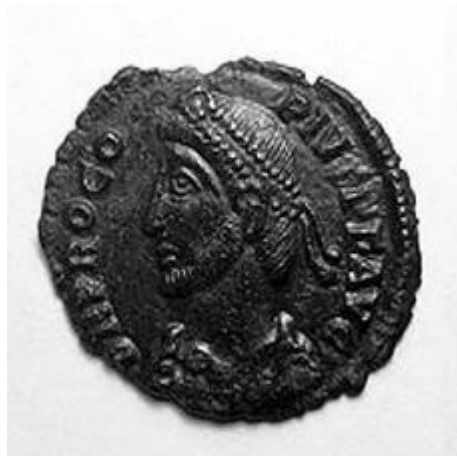
PROCOPIVS 365-366 d.C.

< http://www.storiadelmondo.com/52/giambonino.bronzi.pdf > in Storiadelmondo n. 52, 7 aprile 2008