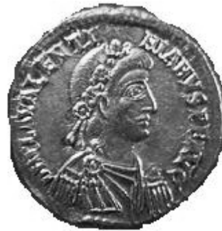
VALENTINIANVS III 425-455 d.C.

Normale legenda al rovescio: DN VALENTINIANVS PF AVG, DN PLA VALENTINIANVS PF AVG, DN VALENTINIANO PF AVG Zecche: Roma, Aquileia, Treviri