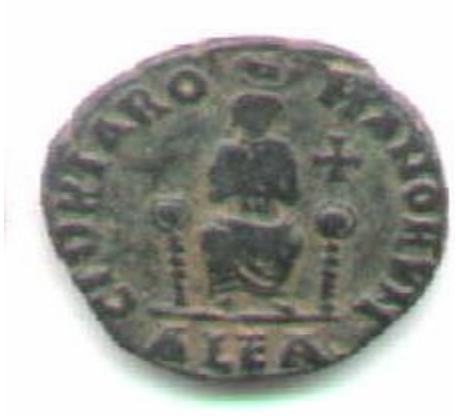
GLORIA ROMANORVM – TIPOLOGIA R5 DI ARCADIVS