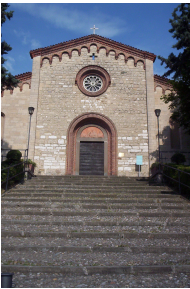
[Fig. 1]: S. Stefano, Rovato (Bs). XI-XII sec. d.C. Veduta dell'ingresso principale.