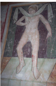
[Fig. 3]: S. Stefano, Rovato (Bs). Affresco policromo del santo pesantemente graffito da punta metallica.